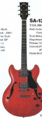
SA-1300 ¥110,000 Body:Arched Birch-Block Top (Center Block - Alder) Neck:Mahogany (Set-in Neck) Fingerboard:Rosewood 22F Pickups:SAH-SAH*2 Controls:2 Volume, 2 Tone, 3P-Selector SW Finish:BS,PR,WL