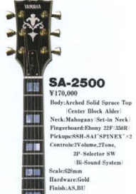
SA-2500 ¥170,000 Body:Arched Solid Spruce Top (Center Block - Alder) Neck:Mahogany (Set-in Neck) Fingerboard:Ebony 22F (50R) Pickups:SSH-SAI*1 SPINEX*2 Controls:2 Volume, 2 Tone, 3P-Selector SW BI-Sound System Scale:62mm Hardware:Gold Finish:AS,BU