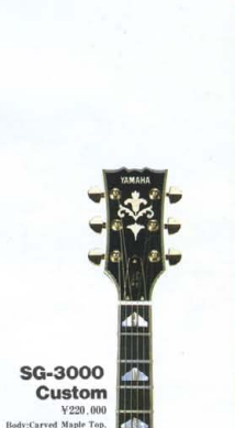
SG-3000 Custom ¥220,000 Body:Carved Maple Top with Mexican ashbone Binding, Mahogany Back (T-Cross Maple) Body Construction Neck:Maple - Mahogany Through Neck Fingerboard:Ebony 22F (50R) Pickups:SGH-ICB SPINEX*2 Controls:2 Volume, 2 Tone 3P-Selector SW (BI-Sound & Direct Circuit System) Scale:62mm Hardware:Gold Finish:BM,WR,GL,CW