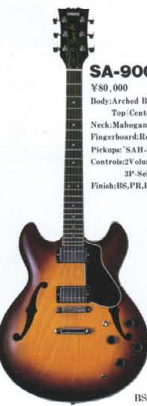
SA-900 ¥90,000 Body:Arched Birch-Block Top:Center Block - Alder Neck:Mahogany (Set-in Neck) Fingerboard:Rosewood 22F Pickups:SAH-SAH*2 Controls:2 Volume, 2 Tone, 3P-Selector SW Finish:BS,PR,BL