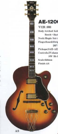
AE-1200 ¥120,000 Body:Arched Solid Spruce Top, Block-Back & Rim Neck:Maple (Set-in Neck) Fingerboard:Striped Ebony 20F (50R) Pickups:SAH-AE1*2 Controls:2 Volume, 2 Tone, 3P-Selector SW (BI-Sound System) Scale:60mm Finish:AS