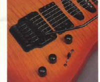
RGX-612J P.U. & Control System

(RGX-612J) マスターボリューム、フロント+センター・リフトオン、5ポジションP.U.セレクター-SWに追加リアコントロールにはバイパスSWを内蔵したシステムが、ヴァーサライズサウンドを切り拓くパワーに溢れています。