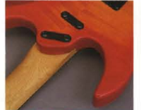
Super Play Ability Joint System

BODY スタンダードカラー・モデル(BL, WH)にはソリッド・バスクワッドを、ユニクスベニヤカラー・モデル(PRS, NBS)にはエレクトリック・ウッドバスクワッドをそれぞれ採用。RGX-600, 500シリーズもメイプルネックと抜群のコンピネーションをみせ、このクラス随一の鳴りを響かせます。シヨントはもちろん、スーパープレイアビリティでイデオシステム。かつてない軽快なハイフレットプレイも可能にしています。さらに、ダブルカッタウェイ部がボディトップを大胆にカットしたデザインがハイポジション部での無類のプレイアビリティを獲得。まさに、ヤマハならではのオリジナルシェイプです(RGX-1200, 800, 600の全モデルに採用)