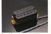
Original Design P.U. "YGH-A100" (500 Series)

ヤマハとアメリカの先進P.U.メーカーEMGが共同開発した次世代のP.U.「YAMAHA SELECT by EMG」——YSES-1 (シングルコイル)&YSEH-1 (ハムバッキング)——をマウント。新たなサウンドゾーンを切り拓くパワーに溢れています。