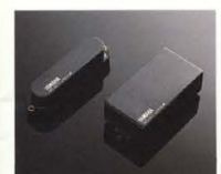
YAMAHA SELECT by EMG "YSES-1* & YSEH-1"