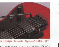
New Design Tremolo System "RMX-II"

(500 Series) シンプルながら基本を押えた最新開発トレモロシステム「RMX-II」をマウント。精悍なブラックフェイス、2点ナイフスイッチ方式が魅力です。