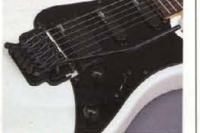
RGX-512J P.U. & Control System

マスターボリューム、マスタートーン、5ポジションP.U.セレクター-SW(520Jのみ3ポジション)。シンプルな構成は、ライブにその威力を発揮します。また、512J, 520Jにはマスタートーン・ノブにバイパスSWも内蔵の最新開発P.U.「YAMAHA SELECT by EMG」の個性を最大限に生かすコントロールシステムです。