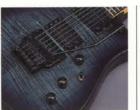
RGX-600J P.U. & Control System (500 Series)

(RGX-620J) シンプルかつプレイアビリティに富んだ、マスターボリューム、フロントボリューム、マスターリフトオンバイパスSW内蔵、3ポジションU.セレクター-SWニューコントロールシステムを採用。多彩な音空間が切り拓いてできるライブパフォーマンスが魅力です。