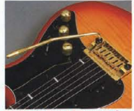
New Design Tremolo "Vintage-Pro"

ジナル"シンクロナイズドメカニズム"はバックラッシュを排除。滑らかなアミングと繊細な耐久性を併せ実現しました。ピッチの不安定感も、一般的なヴィンテージタイプを遙かにしのぐ高性能。アームの磨損はワンタッチでO.O.のスタンプインアウト。また、回転トルクも工具無しでアジャスト可能です。