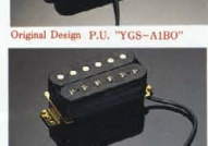
Original Design P.U. "YGS-A1B0"