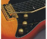
Low Impedance P.U. & Active Control System

さらに、912Jにはこのクラスで初めてロイペンギンP.U.ながら、エレクトロニック・コイルスプリットシステムを搭載。従来のシングルコイルサウンドとは一線を画した、シャープ&ブリリアントなローノイズサウンドを創出します。