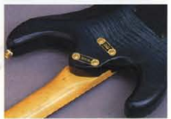
Super Play Ability Joint System & Exoticwood/Alder Body

Jim Dunlop #6100 Frets (Made in U.S.A.) ネットとボディの接合は、ヤマハが生んだ新たなトレンド。独創のスーパープレアピナック。独自のシステム方式でボディアプク、驚くほどのロングサステインを実現。併せて、ハイフレットでのフィンガープレイもスムーズそのものです。