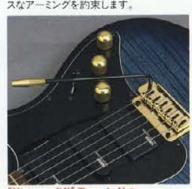
"Vintage-DX" Tremolo Unit

(700 Series) ノンロック・トレモロシステム "Vintage-DX" をマウント。最もトライブショナルで、ポピュラーな2点支持方式のユニットながら、独創の"ローラーナット"との組み合わせにより、かつてないスムーズなアミングを約束します。