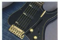
YAMAHA SELECT by EMG "YSES-1" & "YSEH-1"

712Jには、ハムバッキングP.U.の片方のコイルをバイパスして、シングルコイルサウンドを出力する"バイパスシステム"も装備。スイッチはアトーン・ノブに内蔵。