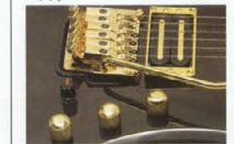
Rockin' Magic II (with Pico P.U.) & Controls

POWER GUERRILLA Iとのバランスは、Mag/Piezo P.U.バランサーによって思いのまま。