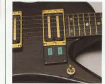
Touch Switch System

CONTROL 最早コントロールと多彩なサウンド・バリエーションをクリエイトする"HRコントロールシステム"は、マスターボリューム、フロントボリューム、マスタートーン、3ポジションP.U.セレクタースイッチ、Piezoスイッチ、タッチスイッチなど、スペシャルファンクションを装備。ボディサイドにはキャリブレーション機能内蔵の本格派シロマチックチューナーもマウント、いつでも、どこでも、LED表示で正確なチューニングが可能です。