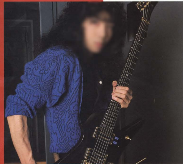
山本恭司 (VOW WOW)