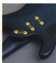
Original Design P.U. "LB-PIZ" & "LB-JIZ"