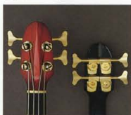
"LB" Headstock & New Design Head Machine

ヤマハが志向するエレクトリック・ベースの未来像を語る“MOTION”コンセプト。人間工学の徹底追究がもたらしたチューニング時の絶妙な扱い易さと、適確なスプリング・テンションをキープするVシェイプヘッドを採用。さらに、あらゆるスプリングゲージに対応すべく、あえてスプリングポスト径を大きくデザインしたプロフェッショナル仕様新開発ヘドが特徴です。また、ナットにはアラス(LB-I)とクワアイト(LB-II)を採用しています。