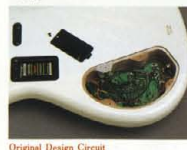
Original Design Circuit

マスターボリューム、パラメーター、ベース、トレブルの4コントロールシステム。アクティブP.U. "LB-PIZ" & "LB-JIZ"とのマッチングを回った新開発のアクティブサーキットを内蔵しています。クリアで広いダイナミックレンジの基本特性に加えて、自在なP.U.バランス、高音域(3.5kHz)を中心に100dBブースト、15dBカット)、低音域(30Hzを中心に100dBブースト、15dBカット)の独立したコントロールにより、イマジネーションのおもむくまま、狙い通りの"LBサウンド"がクリエイトできるフレキシビリティを実現しています。