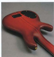
5P Through Neck & Original Design "Round Back" Body

LB-Iは860mmロングスケール、24Fのネックは伝統的250R、Uシェイプ形状。さらに、ヘッドからボディエンドまでを一体化、メイプル、マホガニー、メイプル、マホガニー、そしてメイプルの順で、入念にラミネートされた5ピース・スルーネック構造です。メイプル+マホガニー・スルーネック(BBシリーズ)、アッシュ+メイプル・スルーネック(SBシリーズ)等々で蓄積された、ヤマハ伝統の高貴技術もバリエーションにフォードバック、メイプル主体のスルーネックと、ボディトップのメイプルとを高度に一体化した新たな2ピースメイプル構造を実現しています。さらに、ナット部で40mmという厚身のネック&エボニー指板がシチュで軽快なプレイビリティをプロデュース。