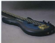
Original Design "Round Top" Body

LB-Iはトップにメイプル、バックにはアルダーと、厳選したマテリアルを採用。メイプルのもつ優れた中高域特性と、アルダー特有の引締まった中低域特性とを鮮やかにコンビネーション。生音のクオリティが既に驚異的です。必要十分な“鳴り”を確保したうえで、コンパクトにまとめたボディシェイプは、表面が流麗なハンダーグドのボディトップ。さらに、裏面にラウンド(カット)バックを施し、プレイヤーと緊密に一体化する抜群のプレイビリティを実現。同時に、隅々にまで入念に塗られている美しい面の流れを活かすラッカーフィニッシュを採用。何回も重ね塗りし、仕上げまでに数10日を要する手の込んだ高級手法は、弾き込むほどにプレイヤーテストに賞賛されています。