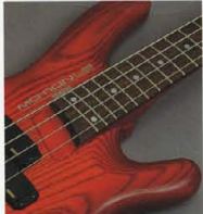
Deep Insert+24F Neck

LB-IIは860mmロングスケール、3ピースラミネートヘッド・メイプルネックにローズウッドフィンガーボード・24F(250R)、Uシェイプ仕様。ニューデザインによるディープインサート方式採用の接合部は、3枚のプレートに各々2本、計6本のボルトでジョイントしたスーパープレイビリティジョイント、ネックとボディとの密着度が極めて高く、弦振動を余すところなくボディに響かせます。また、超ハイポジションでのプレイビリティ抜群です。