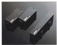
YAMAHA SELECT by EMG "YSEP-1" & "YSEJ-1"

<RBX-600R, 550R, 500R> "Simple is The Best"を具現化した、ヤマハオリジナル・ハイパーブリッジをマウント。弦振動をムダなくボディに伝え、豊かな音の伝達性を確保しました。オーダークラスながらハイパフォーマンスや操作性においても、一般の実力を発揮します。