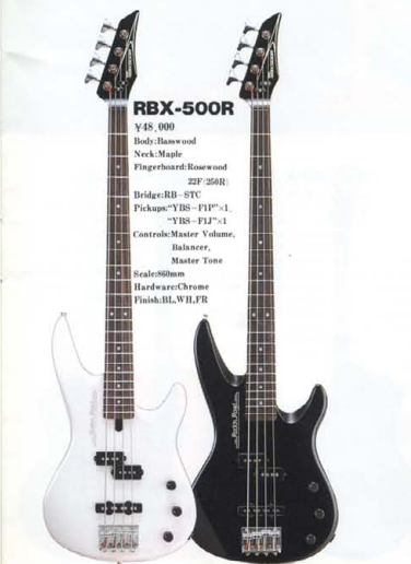
SPR(スパークリングレッド) WH(ホワイト) BL(ブラック)