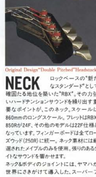
Original Design "Double Pitched" Headstock

高品質による深遠なロングサステーンは、従来のアタッチャブルネックでは味わえなかった"迫力"をクリエイティブします。