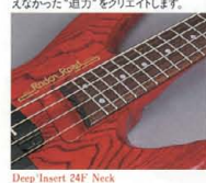
Deep Insert 24F Neck

高品質による深遠なロングサステーンは、従来のアタッチャブルネックでは味わえなかった"迫力"をクリエイティブします。