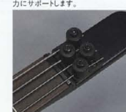
String Lock Head Piece

ネックからストリートラインをキープしたヘッドピースが、安定したローポジションプレイを実現。ヘッドピースは、各弦独立方式により、確実な弦のホルド、素早い弦交換など、多くのメリットを生み出しています。また、ナットはユリア樹脂を採用。開放弦プレイを強力にサポートします。