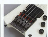
Original Design Piezo "TTB-VIP"

ブリッジ本体は、5層構造のスーパーヘッドレス。マウントされ、超ロングサステーンとダイナミックなサウンドを演出します。BX-1の弦バリエーション・モデル、4弦ベース同様のプレイアビリティで、表現世界を無限に広げます。全てのファンクション、ディテールは、BX-1の先進テクノロジーをパーフェクトに継承。