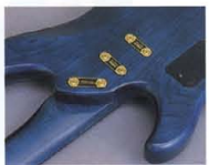
Super Play Ability Joint System

人間工学の追究から生まれたオリジナルのヘッドストック。ヘッドアングルは14度で全ての弦に理想的な弦テンションを得る。さらに、ペグ部に10段階の弦テンションをより、ペグ部のチューニングポジションを実現しました。RBX-850R、他モデルには、ストリングガイドを1&2弦、3&4弦に独立してセッティング、より一層のテンションバランスを確保しています。ペグには、プロフェッショナルからも好評のロッドマチックタイプ"GB7"を採用。ナットは耐摩耗性、さらに弦振動の伝達性にも優れたグラファイトを導入しました。