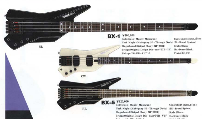
● RBX SERIES COLOR: BL(ブラック), CW(クリーム/ホワイト)

ネック・ディテールは、860mmのロングスケール、24フレット、250Rのフィンガーボード、材質にはメイプル+マホガニーの5ピースを採用し、スルーネック成形。これにナールメイプル+マホガニーのサイズワイドにてボディを一体化。ヤマハ本工技術の粋を集めた3D dimensionシステムから、コンパクトボディとは思えないほどのタイトなボディがベースサウンドをプロデュース。また、演奏中においても実力は超一級。チョッパー奏法におけるプレイ時の右手の安定性、24Fからブリッジまでの自由な位置でのフィンガーレスト&ピッキング、そしてわずか3kgのライトウエイト・ボディが、