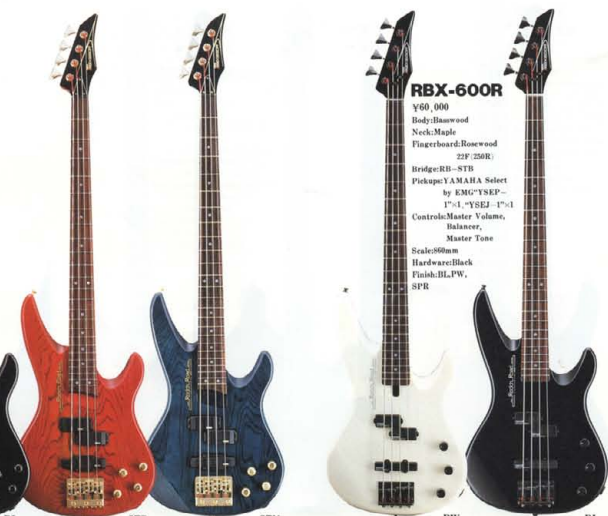
● RBX SERIES COLOR: BL(ブラック), PW(パールホワイト), STR(スーパーストリープ), STN(ナチュラル/エボニー), CAR(キャンディアップルレッド), WH(ホワイト), FR(フライングドッグ)