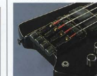
Original Design Piezo "TTB-VIP"

新しいライブパフォーマンス・シーンを開拓します。P.U.には、マグネットにアルニコVを採用したボールピース・タイプのフルカバーダムバック"SAHB-XIC"を搭載。ストレートトーンには、"MB" "LB" シリーズと受け