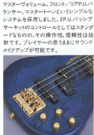
RBX-850R Active Control

<RBX-600R, 550R, 500R> マスターボリューム、フロント/リアP.U.バランサー、マスタートーンというシンプルでシステムを採用しました。2P.U.バシッサーキットのコントロールとしてはスタンダードなもの、その操作性、信頼性は抜群です。プレイヤーの思い通りにサウンドメイクアップが可能です。