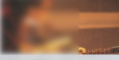
木根尚登 (TM NETWORK)