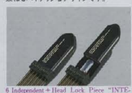
6 Independent Head Lock Piece「INTEGRAL」Neck

エレキロックギター 第3世代コンパクトを象徴するヘッドピース、デザイン。その究極のフォルムは、操作性とサウンドの理想を追求し、昇華させた結果生まれました。各弦独立型のヘッドピースは、全ての弦を確実にホルド、ヘッドカバーにはスライドキャップを導入し、ロードバーをも兼ねるハイテクなデザインです。