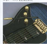
「Vintage-DX」 Tremolo Unit

<700 Series>ノンロック・トレモロシステム「Vintage-DX」をマウント。最もトラディショナルで、ボクサーな高支持方式のユニットながら、独創の「ローラーナット」の組み合わせにより、かつてないスムーズなアームングを約束します。