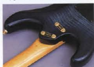
Super Play Ability Joint System & Exotic Wood Alder Body

Jim Dunlop® 6100(Frets)(Made in U.S.A.) ネックとボディの接合は、ヤマハが生んだ新たなトレンド、独創のスーパーブレイクアビリティ・ジョイントシステム方式でビルドアップ。驚くほどのロングサステインを実現。併せて、ハイフレットのフィンガープレイもスムーズそのものです。