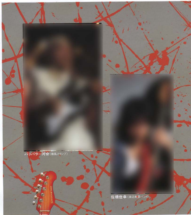
バタフライ関節(楕円スナップ)