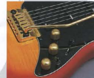
Low Impedance P.U.& Active Control System

さらに、912にはこのクラスで初めてロインピーダンスP.U.ながら、エレキロケット・コイルスプリットシステムを搭載。従来のシングルコイルサウンドには一線を画した、シャープ&プリアントなローノイズサウンドを創出します。