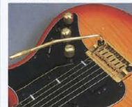
New Design Tremolo「Vintage-Pro」

ジナル「リンクロイズド・メカニズム」はバックラッシュを排除。滑らかなアームングと信頼な耐久性を併せ実現しました。ピッチの不安定も、一般的な「インテリ」タイプを遙かにしのぐ高性能。アームの靱性はワンタッチO.K.のストップ・イン/アウト、また、回転トルクも工具無しでアジャスト可能です。