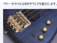
MB-II Control System & Die-Cast "AFB-1G" Bridge

〈MB-1 C, MB-1 PJC〉マスターヴォリューム・バランス・ハムバッキング“B HEART-LI”を搭載。ダブルコイルのマグネットには、ポールピースタイプのアルニコVを採用し、音後輪郭が鮮明で、しかもヘヴィな重低音をプロデュースします。