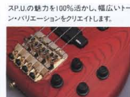
New Design Active Control System

〈MB-II D, MB-III S〉パッシブサーキットを採用した、フロントヴォリューム、リアヴォリューム、マスタートーンのコントロール構成。さらに、MB-II Dには、ミニSW (ON/OFF)によるバイサウンド・システムを装備。P.U.コイルの一方をキャンセルし、シングルコイル・タイプとしても使用でき、