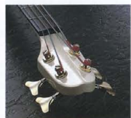
Original Design Head Stock

MBシリーズの象徴、コンバウナリバスVシェイプ・ヘッドは、人間工学の追究から生まれたヤマハのオリジナルデザイン。チューニングがしやすい上に、ナットからペグへの弦の角度が適度に保たれ、理想的なテンションを獲得しています。ペグはトルク調整付きの“GS-7”。ナットにはプラス(MB-1)とコリア樹脂(MB-II&III)を採用しています。