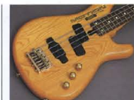
Ash Body & Gold Hardware

も弦高やピッチの狂いを防止します。また、フィンチューニング機構がプレイ中の微調整を可能にするなど、ベースマニアのシビアな要請に応えます。〈MB-III〉ダイキャスト製ブリッジ“BB-II C”をマウント。パワフルでレスポンス性の高いサウンドを確実にかつ強力にサポートします。