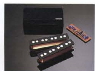
Low Impedance P.U. "B HEART-LI"

〈MB-1 C, MB-1 PJC〉マスターヴォリューム・バランス・ハムバッキング“B HEART-LI”を搭載。ダブルコイルのマグネットには、ポールピースタイプのアルニコVを採用し、音後輪郭が鮮明で、しかもヘヴィな重低音をプロデュースします。