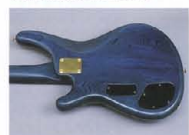
Contoured Cutaway Body