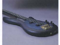
Original Design “Round Top” Body

LB-Iはトップにメイプル、バックにはアルダーと、厳選したマテリアルを採用。メイプルのもつ優れた中域特性と、アルダー一特有の引締まった中低域特性とを鮮やかにコンビネーション。生音のクオリティを既に驚異的です。必要十分な“鳴り”を確保したうえで、コンバットに合わせたボディシェイプは、表面が流麗なハンドラップド・ラウンドトップ。さらに、裏面にラウンド(カット)バックを施し、プレイヤーと緊密に一体化する抜群のリアビリティを実現。同時に、隅々にまでムグのない、極めて美しい面の流れを構成しています。塗装には素材の美しさを活かすラッカーフィニッシュを採用。何回も重ね塗りし、仕上げまでに数10日を要する手の込んだ高級手法は、弾き込むほどにプレイヤーに馴染みに変化していきます。