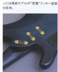
Original Design P.U. “LB-P1Z” & “LB-J1Z”

LB-IIは生音のクオリティを最重視し、厳選されたホワイアッシュ材をセンター2プライ構成で採用。全音域にわたるメリハリが効いたトーンキャラクターはアッシュならではのものです。LB-Iとは異なる、独特の味わいを得ています。ボディスタイルはLB-I同様、アクティブなコンパクトシェイプ。独自のラインで構成されたラウンドトップ。さらにハイポジション部のディレイカクウェイにより、豊かなサウンドと24Fに至るまで変ることのない、スムーズなフィンギングを約束します。なお、フィニッシュ