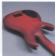
5F Through Neck & Original Design “Round Back” Body

LB-Iは860mmロングスケール、24Fのネックは伝統的250R、Uシェイプ形状。さらに、ヘッドからボディエンドまでを一体化。メイプル、マホガニー、メイプル、マホガニー、そしてメイプルの種類で、入念にラミネートされたヒース・スルーネック構造です。メイプル+マホガニー+スルーネック(BBシリーズ)、“クローズドメイプル+スルーネック”(SGシリーズ)等々で蓄積された、ヤマハ伝統の高度技術をパーフェクトにフィードバック、メイプル主体のスルーネックと、ボディトップのメイプルとを高度に一体化した新たなクローズドメイプル構造を実現しています。さらに、ナット部で40mmという細身のネック&エポニー指板が、シチュアで軽快なプレイビリティをプロデュース。