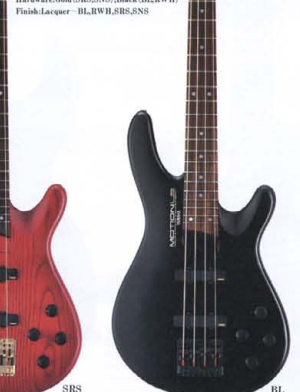
●LB SERIES COLOR: BL(ブラック), RWII(ホワイトボディ), SRS(シースルーレゾナントカラー), SNS(スノーホワイト(ブルーインテーター))

LB-IIJJ ¥150,000 Body: Ash (Round Top) Neck: Maple (Deep-Insert Joint) Fingerboard: Rosewood 21F (250R) Bridge: Die-Cast OGBE-205 Pickups: Active P.U. “LB-P1Z” & “LB-J1Z” Controls: Master Volume, Balancer, Trebble Control, Bass Control