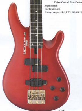
●LB SERIES COLOR: BL(ブラック), RWII(ホワイトボディ), SRS(シースルーレゾナントカラー), SNS(スノーホワイト(ブルーインテーター))

LB-I ¥150,000 Body: T-eras Maple (Round Top) +Alder (Round Back) Neck: Maple+Mahogany (5F-Through Neck) Fingerboard: Ebony 21F (250R) Bridge: Die-Cast OGBE-205 Pickups: Active P.U. “LB-P1Z” & “LB-J1Z” Controls: Master Volume, Balancer, Trebble Control, Bass Control