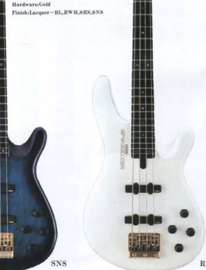
●LB SERIES COLOR: BL(ブラック), RWII(ホワイトボディ), SRS(シースルーレゾナントカラー), SNS(スノーホワイト(ブルーインテーター))

LB-IJJ ¥150,000 Body: T-eras Maple (Round Top) +Alder (Round Back) Neck: Maple+Mahogany (5F-Through Neck) Fingerboard: Ebony 21F (250R) Bridge: Die-Cast OGBE-205 Pickups: Active P.U. “LB-P1Z” & “LB-J1Z” Controls: Master Volume, Balancer, Trebble Control, Bass Control