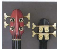
“LB”Headstock & New Design Head Machine

ヤマハが志向するエレクトリック・ベースの未来像を語る“MOTION”コンセプト、人間工学の徹底追究がもたらしたチューニング時の絶妙な扱い易さと、適確なスリング・ポジションをキープするVシェイプヘッドを採用。さらに、あらゆるスリングゲージに対応すべく、あえてスリングポスト径を大きくデザインしたプロフェッショナル仕様新開発ベグが特徴です。また、ナットにはプラス(LB-I)とグラファイト(LB-II)を採用しています。