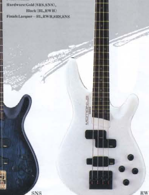
●LB SERIES COLOR: BL(ブラック), RWII(ホワイトボディ), SRS(シースルーレゾナントカラー), SNS(スノーホワイト(ブルーインテーター))

LB-II ¥150,000 Body: Ash (Round Top) Neck: Maple (Deep-Insert Joint) Fingerboard: Rosewood 21F (250R) Bridge: Die-Cast OGBE-205 Pickups: Active P.U. “LB-P1Z” & “LB-J1Z” Controls: Master Volume, Balancer, Trebble Control, Bass Control