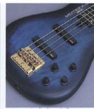
Original Design 4Control System & Die-cast Bridge