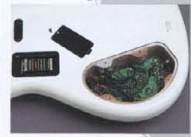
Original Design Circuit

マスターボリューム・トーン・バランサー、ベース・トレブルの4コントロールシステム。アクティブP.U. “LB-P1Z” & “LB-J1Z”とのマッチングを促した新開発のアダプターキットを内蔵しています。クリアで広いダイナミックレンジの基本特性に加えて、自在なP.U.バランサー(高音域(3.5kHz)を中心に0dBブースト、15dBカット)、低音域(30Hzを中心に10dBブースト、15dBカット)の独立したコントロールにより、イメージーションのおもむくまま、狙い通りの“LBサウンド”がクリエイトできるフレキシビリティを実現しています。