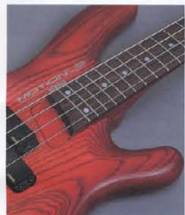
Deep Insert+24F Neck

LB-IIは860mmロングスケール、3ピースラミネートド・メイプルネックにローズウッドフィンガーボード+24F (250R)、Uシェイプ仕様。ニューデザインによるディープインサート方式採用の接合部は、3枚のプレート各々2本、計6本のボルトでジョイントしたスーパーリアビリティジョイント。ネックとボディとの密着度が極めて高く、弦振動を余すことなくボディに響かせます。また、超ハイポジションでのプレイビリティも抜群です。