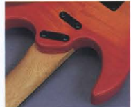
Super Play Ability Joint System

スタンダードカラー・モデル (BL, WH) にはソリッド・バースツッドを、ニューズペシャルカラー・モデル (PRS, NBS) にはエキゾチックウッドバースツッドをそれぞれ採用。RGX-600、500シリーズともメイプルネックと抜群のコンビネーションをみせ、このクラス随一の鳴りを響かせます。ジョイントはもちろん、スーパーブレイクアビリティジョイントシステム、かつてない軽快なハーフレフトプレイを可能にしています。さらに、ダブルカッタウェイ部のポディットを大幅にカットしたデザインがバイポジション部での高域のブレイクアビリティを獲得。まさに、ヤマハならではのオリジナルシェイプで採用 (RGX-1200、800、600の全モデルに採用)。