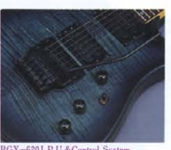
RGX-620J P.U. & Control System

(RGX-612J) シングルかつブレイクアビリティに富んだ、マスターボリューム、フロントボリューム、マスタートーン (バイサウンSW内蔵)、3ポジションP.U.セレクター-SWのニューコントロールシステムを採用。多彩な音空間が切り拓いてくれるライブパフォーマンスが魅力です。