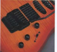
RGX-612J P.U. & Control System

マスターボリューム、フロント+センター・リニア・リアトーン、5ポジションP.U.セレクター-SWに加え、リアトーン・ノブにはバイサウン・SWを内蔵したシステムが、ヴァーサイルなサウンドを切り拓いて、このクラス最上のパフォーマンスを誇ります。