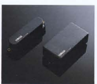
YAMAHA SELECT by EMG "YSES-1" & "YSEH-1"

■"YSEH-1" HUMBUCKING P.U. 十分なパワー感と透明感ながら、モダンなサウンドを追求したハムバッキングピックアップ。"磁界の拡大"をコンセプトに、独特のマグネットレンジ&レリアウトを施しています。