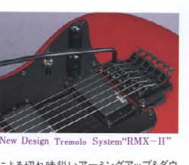
New Design Tremolo System "RMX-II"

(500 Series) シンプルながら基本を押した最新型トレモロシステム"RMX-II"をマウント。精緻なブラックフェイス、2点ナックラフ方式