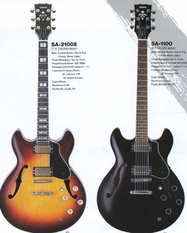
●SA&AE SERIES COLOR : AS(アンティークステイン), BU(バーガンディレッド), BS(ブラック/ヤシロース), ORS(オレンジ/ヤシロース), BL(ブラック), NT(ナチュラル)

SA-2100II ② ¥139,000 (税別) Body: Arched Block + Birch Top (Center Block + Alder) Neck: Mahogany (Set-in Neck) Fingerboard: Ebony 22F 15BR Pickups: SAH-SAG (Alders) x2 Controls: Volume, Tone, IP-Selector SW BI-Sound System) Scale: 625mm Hardware: Gold Finish: BU, AS, BL, NT SA-1100 ② ¥95,000 (税別) Body: Arched Block + Birch Top (Center Block + Alder) Neck: Mahogany (Set-in Neck) Fingerboard: Rosewood 22F 15BR Pickups: SAH-SAG (Alders) x2 Controls: Volume, Tone, IP-Selector SW BI-Sound System) Scale: 625mm Hardware: Chrome Finish: BS, ORS, BL, NT