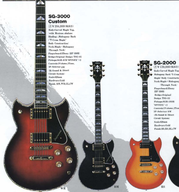
●SG SERIES COLOR : BM(ブラック), WR(ホワイト), GL(ゴールド), BS(ブラック/ヤシロース), RS(レッド/ヤシロース), BL(ブラック), CW(クリーム/ホワイト)

T-cross Maple, Through Neck SG-3000&2000は、日・米・英・西独の好評をもつアーチドトップボディとネック構造の革新を採用しています。T字型に組合せたメイプルにバック材のマホガニーをラミネートしたブロックを、ボディトップからエンドまで一体で削り出し、メテアル双方の長所を引き出す「Tクロスメイプル・スルーネック」は、豊かなロングサスティーンをプロデュースするヤマハ独自の手法です。また、ヒール部を滑らかに削り出せる構造のため、無頓のプレイアビリティもあわせて実現しています。