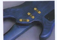
Super Play Ability Joint System