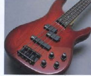
RBX-MS II Series P.U. & Control System

PICK UP:(RBX-MS II SERIES)新世代のハイインピーダンスP.U.「YAMAHA SELECT by EMG」を搭載。「YSEP-1」と「YSEI-1」のP.U. コンビネーションが、あらゆるジャンルにおいてダイナミクスあふれるベースサウンドをクリエイト。(RBX-MS III)セラミックマグネットを採用した新開発P.U.「YBS-F2PC」と「YBS-F2JC」を搭載。ミディアムスケールモデル専用ハイコンプレックスが際立ち、ボディサイズとのイメージを超えたバワフルなサウンドを演出します。