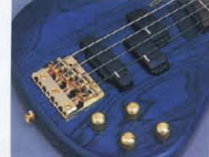
RBX-850R Active Control

(RBX-600R、550R、500R) マスターボリューム、フロント/リアP.U.パラランサー、マスタートーンというシンプルなしステムを採用しました。2P.U.バッシングサーキットのコントロールとしてはスタンダードなもの、その操作性、信頼性は抜群です。プレイヤーの思うままにサウンドメイクアップが可能です。