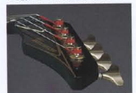
Original Design "Double Pitched" Headstock

人間工学の追究から生まれたオリジナルシェイプのヘッドストック。ヘッドアングルの14度で、さらに理想的な弦傾斜の仕様により、ベストチューニングポジションを実現しました(RBX-850R)。他モデルには、ストリングガイドと2弦、3弦に独立してセッティング、より一層のテンションバランスを確保しています。ペグには、プロフェッショナルからも好評のロッドマチックタイプ「GB」を採用。ナットは耐摩耗性、さらに弦振動の伝達性にも優れたグラファイトを導入しました。