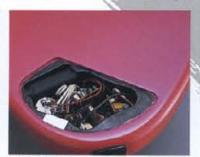
RBX-MS II Series New Design "Active" Circuit

「YAMAHA SELECT by EMG」P.U.からの信号をマキシマムに生かすべく、アクティブサーキットを採用。ミディアムスケールのボディサイズを考慮し、専用の高周波特性を確保。ワイドなダイナミックレンジを獲得し、プロフェッショナルレベルのサウンドクリエイトを達成しています。システム/ノブは、マスターボリューム、パラランサー、トレブル、ベースの構成。トレブルおよびベースは、±12dBのブーストカットが可能。幅広いサウンドクリエイティブを楽しめることができます。