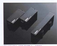
YAMAHA SELECT by EMG "YSEP-1" & "YSEI-1"

ヤマハとアメリカ有数のピックアップメーカー「EMG」の共同開発により誕生したP.U.——「YSEP-1」と「YSEI-1」を採用。クリアで歯切れのよいベーストーンは、まさにクレイジー!