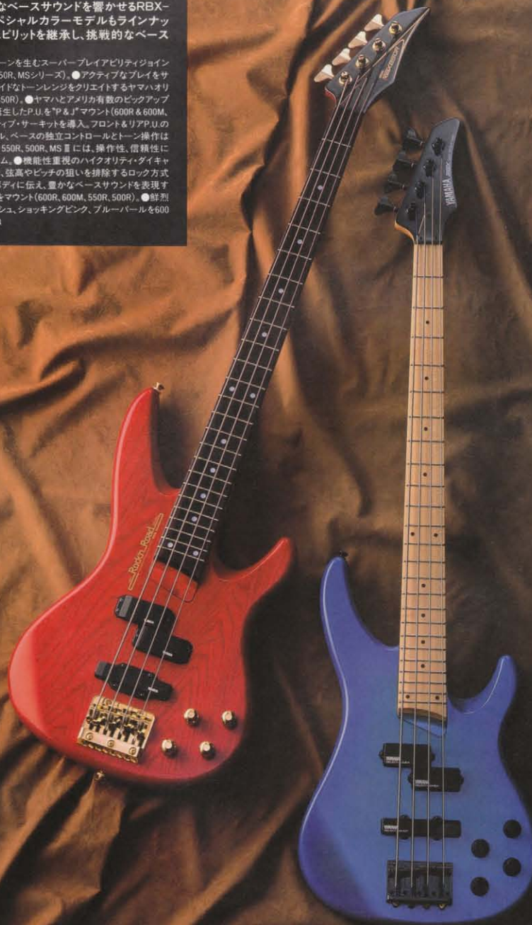
LEFT: RBX-850R STR ¥81,000 RIGHT: RBX-MS II M BL ¥65,000 価格は全てメーカー希望小売価格(税抜き価格)です。

●高密度性により深みのあるサスティーンを生むスーパーブレイアビリティジョイントシステム+ディープインサート方式 (850R, MSシリーズ)。●アクティブなブレイをサポートするライトウェイトボディ。●超ワイドなトーンレンジをクリエイトするヤマハオリジナル・ローインピーダンスP.U.搭載 (850R)。●ヤマハとアメリカ有数のピックアップメーカー「EMG」との共同開発により誕生したP.U.を「P」と「J」マウント (600R & 600M, MS II シリーズ)。●4コントロールアクティブ・サーキットを導入。フロント&リアP.U.の微妙なトーンニュアンスの設定、トレブル、ベースの独立コントロールとトーン操作は自在 (850R, MS II シリーズ)。●600R, 550R, 500R, MS II には、操作性、信頼性に優れた3コントロールのシンプルシステム。●機能性重視のハイクオリティ・ダイキャストブリッジを搭載。ブリッジサドルには、弦高やピッチの狙いを排除するロック方式を採用 (850R)。●弦振動をムダなくボディに伝え、豊かなベースサウンドを表現するヤマハオリジナル・ハイパーブリッジをマウント (600R, 600M, 550R, 500R)。●鮮烈なビリー・シーン・スペシャル・フィニッシュ。ショッキングピンク、ブルーパールを600M, MS II に展開。◎ラインナップ14P34