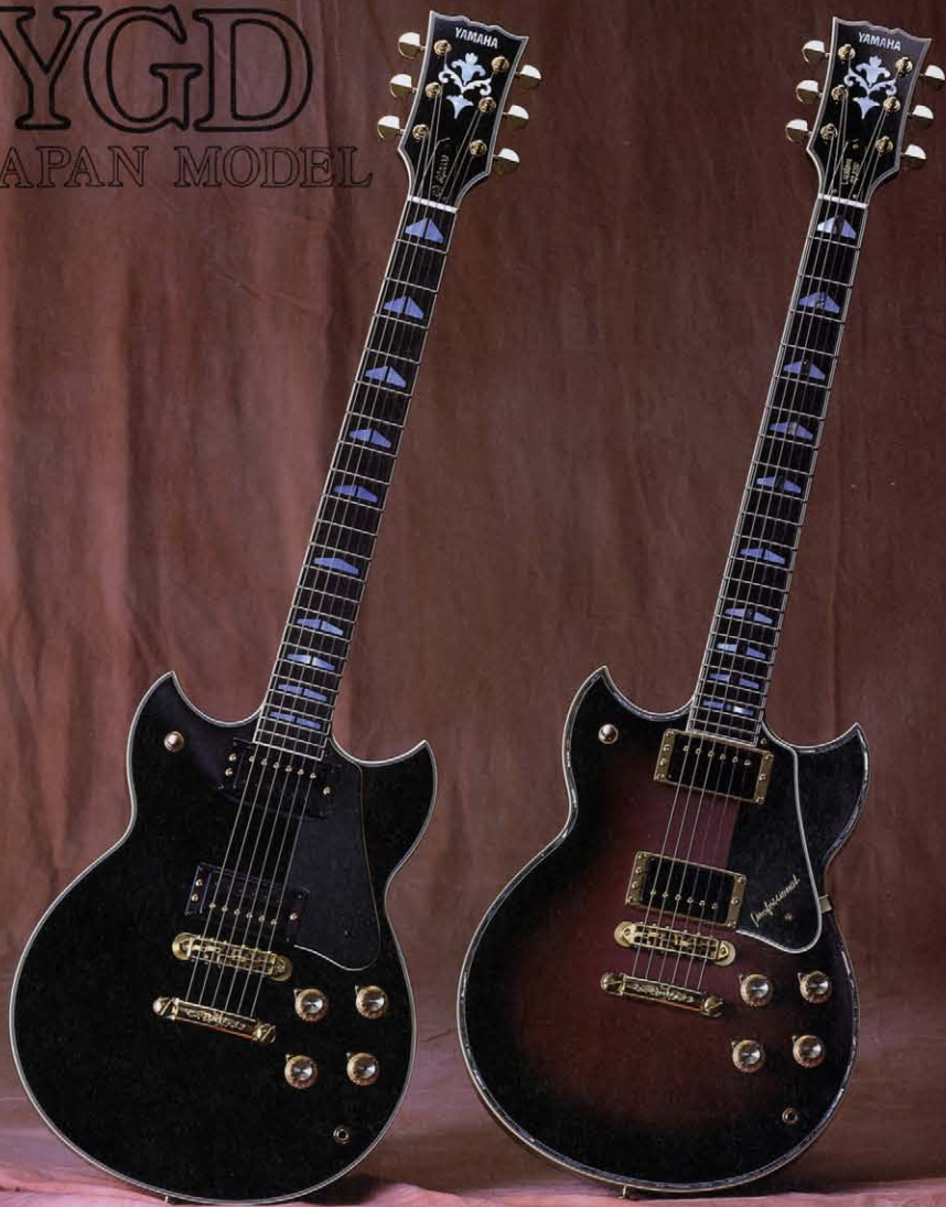
LEFT:SG-2000(BL) CENTER:SG-3000(WR) RIGHT:SG-1000(RS)