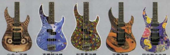
山中一正様 高橋邦法様 杉若真治様 玉置淳様 田中龍由佳様