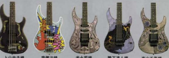
上山尚子様 南條治様 米永哲様 鴨下達人様 高山千年様