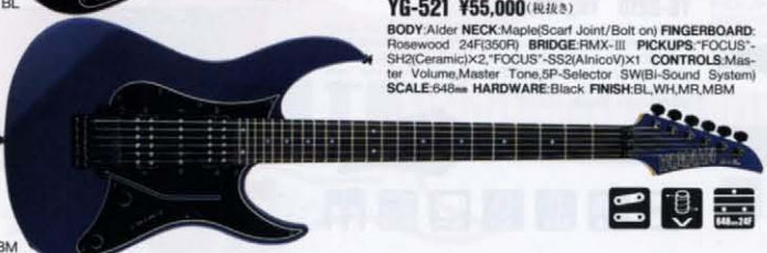
YG-521 ¥55,000 (税抜き)

BODY:Alder NECK:Maple/Scarf Joint/Bolt on) FINGERBOARD:Rosewood 24F(350R) BRIDGE:RMX-III PICKUPS:"FOCUS"-SH2(Ceramic)x2 "FOCUS"-SS2(AnicoV)x1 CONTROLS:Master Volume,Master Tone,5P-Selector SW(Bi-Sound System) SCALE:648mm HARDWARE:Black FINISH:BL,WH,MR,MBM