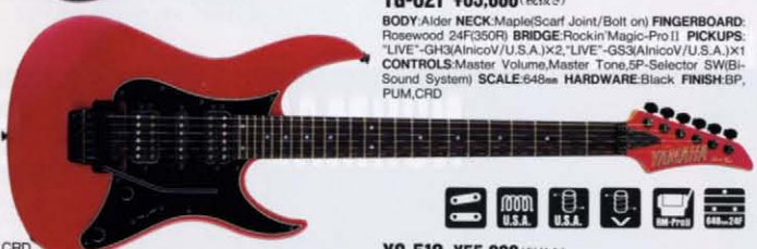
YG-621 ¥65,000 (税抜き)

BODY:Alder NECK:Maple/Scarf Joint/Bolt on) FINGERBOARD:Rosewood 24F(350R) BRIDGE:Rockin' Magic-Pro II PICKUPS:"LIVE"-GH3(AnicoV/U.S.A.)x2 "LIVE"-GS3(AnicoV/U.S.A.)x1 CONTROLS:Master Volume,Master Tone,5P-Selector SW(Bi-Sound System) SCALE:648mm HARDWARE:Black FINISH:BP,PUM,CRD