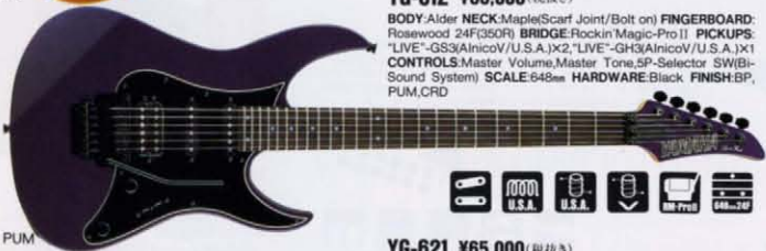
YG-612 ¥65,000 (税抜き)

BODY:Alder NECK:Maple/Scarf Joint/Bolt on) FINGERBOARD:Rosewood 24F(350R) BRIDGE:Rockin' Magic-Pro II PICKUPS:"LIVE"-GS3(AnicoV/U.S.A.)x2 "LIVE"-GH3(AnicoV/U.S.A.)x1 CONTROLS:Master Volume,Master Tone,5P-Selector SW(Bi-Sound System) SCALE:648mm HARDWARE:Black FINISH:BP,PUM,CRD