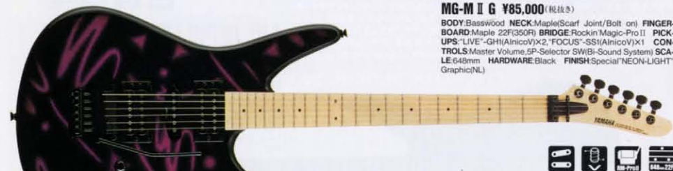
MG-M II G ¥85,000 (税抜き)

BODY:Basswood NECK:Maple/Scarf Joint/Bolt on) FINGERBOARD:Maple 22F(350R) BRIDGE:Rockin' Magic-Pro II PICKUPS:"LIVE"-GH1(AnicoV)x2 "FOCUS"-SS1(AnicoV)x1 CONTROLS:Master Volume,5P-Selector SW(Bi-Sound System) SCALE:648mm HARDWARE:Black FINISH:Special"NEON-LIGHT" Graphic(NL)