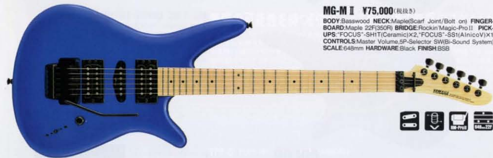
MG-M II ¥75,000 (税抜き)

BODY:Basswood NECK:Maple/Scarf Joint/Bolt on) FINGERBOARD:Maple 22F(350R) BRIDGE:Rockin' Magic-Pro II PICKUPS:"FOCUS"-SH1(Ceramic)x2 "FOCUS"-SS1(AnicoV)x1 CONTROLS:Master Volume,5P-Selector SW(Bi-Sound System) SCALE:648mm HARDWARE:Black FINISH:SSB