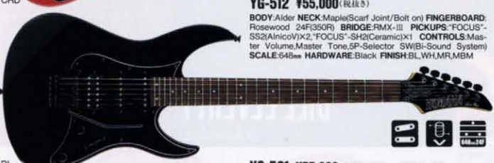
YG-512 ¥55,000 (税抜き)

BODY:Alder NECK:Maple/Scarf Joint/Bolt on) FINGERBOARD:Rosewood 24F(350R) BRIDGE:RMX-III PICKUPS:"FOCUS"-SS2(AnicoV)x2 "FOCUS"-SH2(Ceramic)x1 CONTROLS:Master Volume,Master Tone,5P-Selector SW(Bi-Sound System) SCALE:648mm HARDWARE:Black FINISH:BL,WH,MR,MBM