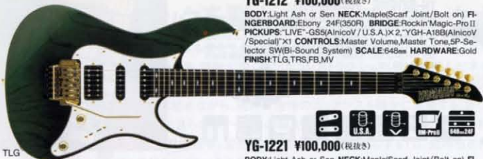
YG-1212 ¥100,000 (税抜き)

BODY:Light Ash or Sen NECK:Maple/Scarf Joint/Bolt on) FINGERBOARD:Ebony 24F(350R) BRIDGE:Rockin' Magic-Pro II PICKUPS:"LIVE"-GS3(AnicoV/U.S.A.)x2 "YGH-A16B(AnicoV/Special)"x1 CONTROLS:Master Volume,Master Tone,5P-Selector SW(Bi-Sound System) SCALE:648mm HARDWARE:Gold FINISH:TLG,TRS,FB,MV