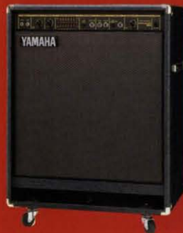
SR160B-115 160W ¥150,000 (税抜き)

●定額出力(1A 310Hz)=80W/8Ω ●スピーカー=38cm(8Ω)×1、JK3E2 ●コントロール=マスターボリューム、3バンドグラフィックイコライザー、トーンコントロール、ゲイン、リミッター、アクティブ/パッシブ2インプット、エフェクトセンド、エフェクトリターン ●出力端子=インプット(HIGH×1、LOW×1)、エフェクトリターン ●出力端子=ラインアウト、エフェクトセンド、フットスイッチ ●LED=パワー、コンプ、ミッドシェイプ、オーバーロード ●寸法=607W×807H×380D(mm) [キヤスター含む] ●重量=49kg