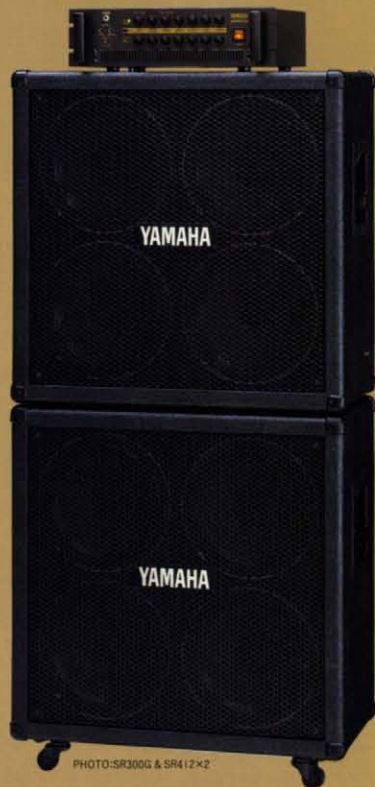
SR300G(HEAD AMPLIFIER) ¥180,000 (税抜き) SR412(SPEAKER SYSTEM) ¥130,000 (税抜き)

チューブ本来のパワーを解放し、ロック・サウンドの核である歪みとクリーンを徹底的に磨き上げたSRギター・アンプリアファイア。3チューブのプリアンプ部、MOS-FETのパワーアンプ部、そしてセレクション製12インチ・スピーカーをはじめ、最上質かつ理想的なスペックを採用し、圧倒的な音圧感と音質を誇る最高出力300W(4Ω)サウンドを創出する。もちろん、ナチュラル・クランなどへのサウンド発展性もフレキシブル。あらゆる状況において、パワーに負けることなく、レコーディング・クオリティをキープ。1アンプ1個性という、従来のチューブ・スタックابلアンプが持っていた価値観を根底から覆すパフォーマンスを發揮する。