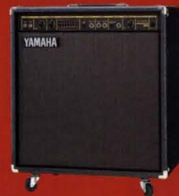
SR80B-115 80W ¥110,000 (税抜き)

●定額出力(1A 310Hz)=80W/8Ω ●スピーカー=38cm(8Ω)×1、JK3E2 ●コントロール=マスターボリューム、3バンドグラフィックイコライザー、トーンコントロール、ゲイン、リミッター、アクティブ/パッシブ2インプット、エフェクトセンド、エフェクトリターン ●出力端子=インプット(HIGH×1、LOW×1)、エフェクトリターン ●出力端子=ラインアウト、エフェクトセンド、フットスイッチ ●LED=パワー、コンプ、ミッドシェイプ、オーバーロード ●寸法=607W×807H×380D(mm) [キヤスター含む] ●重量=49kg