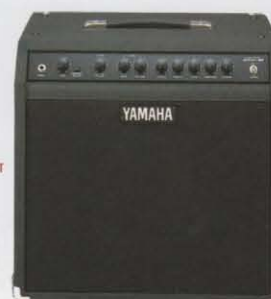
NEW MODEL SR50-112 [50W モデル] ¥80,000(税抜き)

●定格出力=100W/8Ω ●スピーカー=ELECTRO VOICE FORCE12(30cm 8Ω)×1 ●リバーブユニット=サウンド・エンハンスメント(旧アキュロニクス) ●プリアンプ使用素子=FET ●コントロールリム、チャンネルセレクタSW、リバーブチャンネルセレクタ(プルアップ)、ドライブW、トレブル、ミッド、ベース、[D]ライブチャンネルセレクタ(プルアップ)、リバーブ、トランプ、リド、ペーシ、[リブ]アンプ共通プレゼンス、ドライブ、スレバウト端子、D.F.C.(ドライブノーマル/ウェット)、エフェクトセンド/リターン端子 ●定格電力SW=20dBm/40dBm ●出力端子=インプット、エフェクトリター、出力高インピーダンス、スレバウト、スピーカーアウト ●フットスイッチは2S-1専用 ●LED=オーバーロードインジケータ、リバーブチャンネルインジケータ、ドライブチャンネルインジケータ ●寸法=477W×471H×272D(mm) ●重量=20.5kg ●消費電力=65W