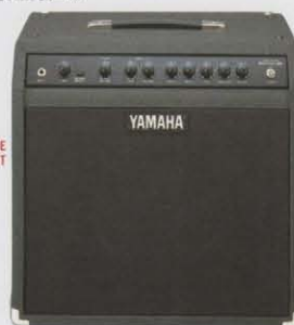
NEW MODEL SR100-112 [100W モデル] ¥98,000(税抜き)

●定格出力=100W/4Ω ●スピーカー=CELESTION G12M-70(30cm 8Ω)×2 ●リバーブユニット=サウンド・エンハンスメント(旧アキュロニクス) ●プリアンプ使用素子=FET ●コントロールリム、チャンネルセレクタSW、リバーブチャンネルセレクタ(プルアップ)、ドライブW、トレブル、ミッド、ベース、[D]ライブチャンネルセレクタ(プルアップ)、リバーブ、トランプ、リド、ペーシ、[リブ]アンプ共通プレゼンス、ドライブ、スレバウト端子、D.F.C.(ドライブノーマル/ウェット)、エフェクトセンド/リターン端子 ●定格電力SW=20dBm/40dBm ●出力端子=インプット、エフェクトリター、出力高インピーダンス、スレバウト、スピーカーアウト ●フットスイッチは2S-1専用 ●LED=オーバーロードインジケータ、リバーブチャンネルインジケータ、ドライブチャンネルインジケータ ●寸法=689W×367H×283D(mm) [キヤスター含む] ●重量=26kg [キヤスター含む] ●消費電力=65W