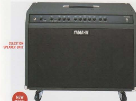
NEW MODEL SR100-212 [100W モデル] ¥110,000(税抜き)

■ダンピング・ファクターとは、スピーカーユニットの制動(ダンピング)に関係する値。リアパネルに搭載のD.F.C.は、アンプの音質を3タイプに切り替え操作できるシステムだ。一般的なアンプでは固定されている、パワーアンプの内部抵抗とスピーカーのインピーダンスおよび接続コードの抵抗などで規定されるダンピング・ファクター値を、出力インピーダンスを変化させることでコントロール可能としている。この新機能により、SRのサウンド・キャラクターはドライブからウェットまで劇的に変化する。