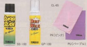
このページの商品の価格は全てメーカー希望小売価格(税抜き価格)です。