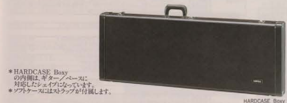
*HARDCASE, Boxyの内側は、ギター・ベースに 対応したシェイプになっています。 *ソフトケースにはストラップが付属します。