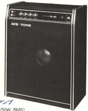
●ベースギターアンプ B-50 (50W RMS) 58,000円

●出力 / 50W (R.M.S) 8Ω負荷 ●スピーカー30cm(8Ω)×1 ●コントロール部分 / ボリューム、トレブル(プル・ブライツ)、バス、ディストーション、トレモロ (ディップス、スビード)、リバーブ ●インプット / HI: 15mV, LOW ●感度 / 10mV (1kHz), 30m (1kHz) ●トランジスター×23 ●ダイオード×14 ●ヘッドホンジャック / 16~4Ω ●スピーカー出力ジャック / 8Ω 50W ●ライン出力ジャック / 不平衡 (0dBm) ●外形寸法 / 500(W)×260(D)×500(H)mm ●重量 / 16kg ●消費電力 / 46W