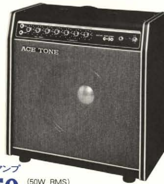
●ギターアンプ G-50 (50W RMS) 55,800円

●出力 / 35W (R.M.S) 8Ω負荷 ●スピーカー30cm(8Ω)×1 ●コントロール部分 / ボリューム、トレブル(プルブライト)、バス、ディストーション、トレモロ、リバーブ ●ノイズ / 30mV以下 ●感度 / HI: 15mV, LOW: 45mV ●トランジスター×16 ●ダイオード×8 ●外形寸法 / 455(W)×220(D)×470(H)mm ●重量 / 12kg ●消費電力 / 35W