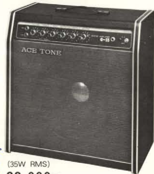
●ギターアンプ G-35 (35W RMS) 38,000円

●出力 / 15W (R.M.S) 8Ω負荷 ●スピーカー30cm(8Ω)×1 ●コントロール部分 / ボリューム、トレブル、バス、ディストーション、リバーブ ●ノイズ / 20mV以下 ●感度 / HI: 15mV, LOW: 45mV ●トランジスター×13 ●ダイオード×6 ●外形寸法 / 405(W)×200(D)×470(H)mm ●重量 / 10kg ●消費電力 / 25W