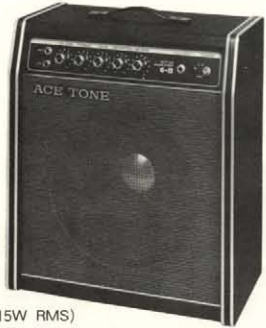
●ギターアンプ G-15 (15W RMS) 25,800円