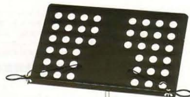
ミュージックスタンド KS-120 ¥11,800