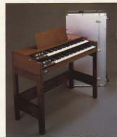
スタンド/ST-3 (ST-1も使用できます) ケース/ハードケース

仕様 ●鍵盤 61鍵(C-C)×2段(コントロールセクション) [ ]内は上下独立に装備(●ドローバー×9: 16、5%、8、4、2%、2、1%、1'×2) ●プリセット/ドローバーズ: I、II、III、IV ●パーカッション: 4'、2% ●パーカッションボリューム ●オーバードライブ ●キークリック ●トーンコントロール: バス、トレブル ●チューン: チューン(±50セント) ●ロータリーエフェクト: オン、ファースト ●コーラス/ビブラート: モード切替 ●コーラス×3、ビブラート×3、アップバー、ロー ●ボリューム/パワースイッチ ●キークリック ●キークリックボリューム ●出力ジャック: シグナルアウト(HIGH/LOW)、アクセサリ ●入力ジャック: アクセサリーリターン、ロータリーエフェクト(スロー/ファースト) ●外形寸法: 1149(W)×193(H)×530(D)mm ●重量: 22.5kg ●付属品: 接続コード、ダストカバー、専用立て、2chボリュームペダルFK-3、フットスイッチS-1 ●電源: 100V、50/60Hz ●消費電力: 12W