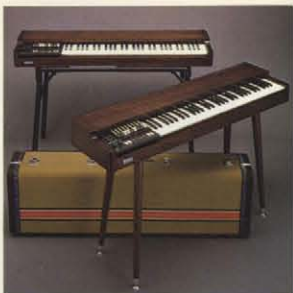
スタンド/タイプC(前)、ST-2(後) ケース/ハードケース