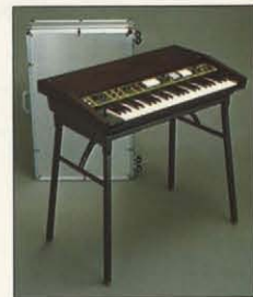
スタンド/ST-1 ケース/ハードケース

●オプション FOOT SWITCH S-1 フットスイッチ FOOT CONTROLLER MS-01 フットコントローラー