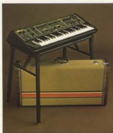
スタンド/ST-1 ケース/ハードケース