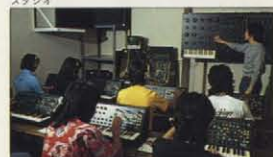
シンセサイザースクール、レッスン風景

コルグシンセサイザースクール ●内容：音の物理学とシンセサイザー ●期間：1ヶ月半(6回)週1回/90分 ●受講料：5000円(6回分) 営業時間 AM10:00 - PM6:30 (月曜のみPM5:30まで)日・祭もオープン 〒160 東京都新宿区新宿7-27-6