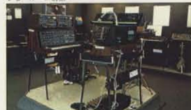
ショールーム フロア