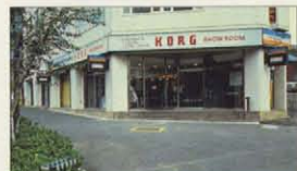
ショールーム 前巻

1968年、我々が初めて開発されたシンセサイザー(試行号機が展示されている他、コルグの全製品を取り揃え、自由に試奏できます。また、技術員があらゆる電子楽器についての質問や相談にお答えいたします。さらに、初歩から高度なテクニクまで、系統的にやさしく覚えられるシンセサイザー教室も開講されています。