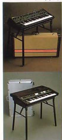
スタンド/ST-1B ハードケース

仕様 ●鍵盤: 48鍵(F-E)(パーカッションセクション) ●音色タブレット: エレクトリックピアノ(16)、クラビ(16)、ピアノ(16)、ハーモニクス(2) ●効果タブレット: サステイン、レモロ ●コントロール: モロスピード、ディケイ(アンサンブルセクション) ●音色タブレット: プラス(16)、オルガン(16)、コーラス(16)、ストリングスI(16)、ストリングスII(8) ●効果タブレット: ビブラートオフ、アタック/リリース/スワップ ●コントロール: コーラス、ストリングスI・IIのみ: アタック、リリース(コントロールセクション) ●アクセント: プラスカットオフ周波数、エレクトリックピアノ/キークリック ●トーン: パーカッション、アンサンブル ●チューン: トータルチューン(±40セント)、チューンA/B(±30セント) ●ボリューム: パーカッション、アンサンブル ●オクターブ: オクターブアップ ●マニュアルコントローラー: コーラスフェイズスイッチ×2(パーカッション、アンサンブル)、ジョイスティック(X方向=ピッチ(±200セント)、Y方向=コーラスフェイズスピード) ●電源スイッチ: パワー(ON/OFF)(入出力セクション) ●入力ジャック: サステイン(Low)、エクステーション入力(パーカッション/パーカッション+アンサンブル/アンサンブル、0/+5V) ●出力ジャック: ミックスアウト、ステレオアウト、ヘッドホンアウト(ステレオ)、キーボードトリガーアウト(マルチプル, Low) ●外形寸法: 824(W)×147(H)×497(D)mm ●重量: 15kg ●付属品: ダストカバー、接続コード ●電源: 100V, 50/60Hz ●消費電力: 25W