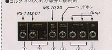
●コルグΔの入出力部分と接続例

パーカッション系は、エレクトリックピアノ、クラビ、ピアノ、ハーモニクス4種類。アンサンブル系は、プラス、オルガン、コーラス、ストリングスI、ストリングスIIの5種類。それぞれの音色をタブレットスイッチによって瞬時に選択し、ミックスして演奏することができるポリフォニックキーボードです。3系統の音源によって合成された音色は非常に高いクオリティーを持ち、パーカッション系とアンサンブル系を独立して再生できるステレオアウト、そしてコーラスフェイズ効果を加えると、1台のキーボードとは思えないほど豊かで広がりのあるサウンドが得られます。また、ジョイスティックによってピッチとコーラスフェイズのスピードを同時にコントロールできます。