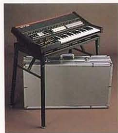
スタンド/ST-1B、ハードケース

仕様 ● 鍵盤: 37鍵(C-C)(トーンセレクター) ● 楽器音×11: エレクトリックベース、チューバ、クラビ、フラスギター、ホルン、トランペット、クラリネット、ダブルリード、ストリングス、フルート、パーカッション ● シンセ音×8: ノイズ1、32、S/H16、IL、16、1/8、1/4、1/8、1/4 (エフェクトセレクター) ● クラップ×2、アップ、ダウン ● エフェクト×5: ホルタメント、ディレイビブラート(INST)、クォータートーン、マルチプルトリガー、キーボード ● コントロール×3: キーボードセンサー、ジョイスティック(INST)、ジョイスティック(SYNTH) ● コントロールセレクション ● ジョイスティック(左): ピッチベンド、ビブラートデプス/ノイズモジュレーションデプス ● ジョイスティック(右): ローパスfc(SYNTH)、ハイパスfc(SYNTH) ● キーボードセンサー切換えスイッチ×2: ピッチベンドアップ/ビブラートデプス/ピッチベンドダウン