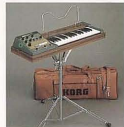
専用スタンド、ソフトケース

シンセ、ブラス、ストリングス、ウッド、ボイスなど 30の音色をプリセット。 アンプ、スピーカーを内蔵した操作性抜群のシンセサイザー。