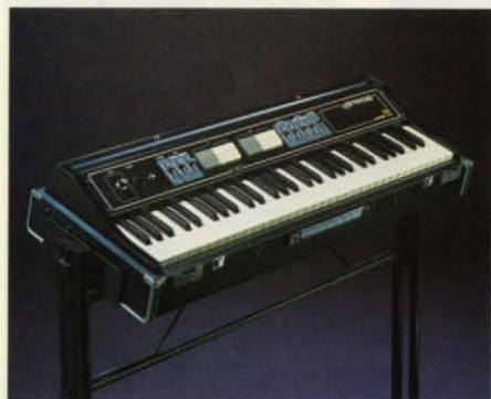
●スタン(FKS-10(別売)) ¥15,000 ●フットボリューム(別売) FV-1 ¥6,800/FV-2 ¥9,000