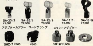
SA-23/2 ¥1,000 SA-25/1 ¥2,500 SA-12/1 ¥3,500 SA-11/1 ¥3,500 SA-18/9 ¥7,000 アダプターケーブル コードクランプ スタンドアダプター SHZ-7 ¥600 Y200 3個装 ¥1,000