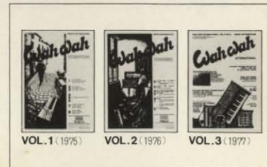
WAH WAH INTERNATIONAL