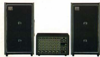
● PS-40スピーカー ¥33,000 × 2