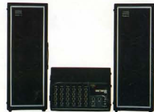
● PA-60 ¥81,000 ● PA-60S ¥34,000 × 2

●許容入力：40W (R.M.S.) ●スピーカー：20cm × 3、インピーダンス 24Ω ●外形寸法：300 (W) × 810 (H) × 200 (D) mm ●重量：15kg ●付属品：スピーカーコード (1.0m)、ピニールカバー