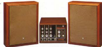
● VX-33スピーカー ¥26,000 (2本1組)

ウッドキャビネットタイプの VX-33 と VX-33S との組み合わせは抜群のコストパフォーマンス。