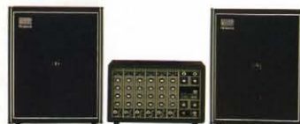
● PS-20スピーカー ¥30,000 (2本1組)

●入力：6チャンネル、入力アタッチター付 ●チャンネルコントロール：ボリューム、トレブル、ベース、エフェクト、スタンバイ ●エフェクトスイッチ ●メインコントロール：ボリューム、バランス、リバーブ、エコー ●出力端子：スピーカー用 × 2 (各 8Ω)、ラインアウト ●その他：エコーチャンパー用端子 (トゥーエコー)、フロムエコー、ACアウトレット ●出力：30W (8Ω) + 30W (8Ω) (R.M.S.) ●消費電力：200 W ●外形寸法：400 (W) × 250 (H) × 275 (D) mm ●重量：10kg ●付属品：ピニール・カバー