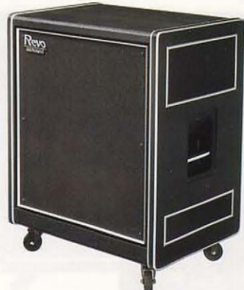
RD-125L レザーキャビネット ステージタイプ ¥208,000/キット¥17,000

●出力:レボ・チャンネル50W(R.M.S.)、ダイレクト・チャンネル75W(R.M.S.) ●コントロール:レボ・チャンネル(トランプ・ベース)、ダイレクト・チャンネル(トランプ・ベース)、リニア・コントロール、クラス・トーン・ビンド・コントロール、リニア・切替スイッチ(0,1,2) ●スピーカー:20cm×3, 20cm(ベース用)×1 ●インプット・コネクタ(8P) ●イコライズ・シグナル・アクト・コネクタ(8P) ●イコライズ ●消費電力:60W ●外形寸法:630(W)×750(H)×450(D)mm ●重量:45kg ●付属品:5mケーブル(C-5A)、ビニールカバー