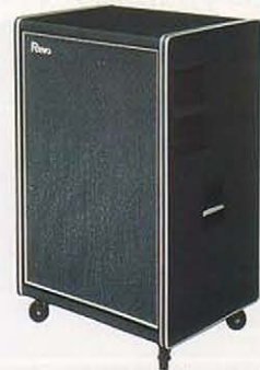
Revo250 レザーキャビネット ステージタイプ ¥280,000/キット含む(免税価格¥258,000)

●レボ・チャンネル:90W(R.M.S.) ●ダイレクト・チャンネル:120W(R.M.S.) ●コントロール:リニア・コントロール、トーン・セレクター、ベース、イコライズ、スピード・センター ●スピーカー:20cm×6/28cmベース用(両方)×2 ●外形寸法:700(W)×1090(H)×520(D)mm ●重量:85kg ●消費電力:無負荷時38W ●付属品:C-5(5m)接続ケーブル、ビニールカバー ●REVO-250用キットには、コンボ・キット(¥15,000)、コントロール・キット(¥12,000)があります。