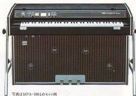
写真はMPA-100とのセット例

MPA-100 PIANO AMPLIFIER ¥160,000 (別売) ●120W(R.M.S.)