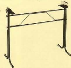
シンセサイザー SH-1000, SH-2000, SH-5, SH-3A, ストリングス RS-505, RS-202, VP-330, コンボピ ア EP-10, EP-30用スタンド。