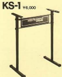
シンセサイザー SH-2, SH-1, SH-09, プロマウス、 ストリングス RS-505, RS-202, VP-330, コンボピ ア EP-10, EP-30用スタンド。