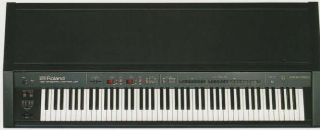
MKB-1000 MIDI KEYBOARD CONTROLLER ¥298,000

どこまでも無限にひろがり続けるMIDIサウンド・ネットワーク。その中心に立つのはあなただ。