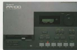
PR-100 MUSIC RECORDER ¥59,800

●MIDIキーボードの演奏を記憶してMIDI音源を自動演奏 ●ワンマン・バンドのシーケンスに、キーボード・プレイのレッスンに大活躍 ●トラック数は録音・再生×2、再生専用×2の4トラック ●同時発音数は最大64音(1トラック) ●記憶量は本体に最大17,000音、2.8インチ・ディスクに最大17,000音 ●複数トラックからのピンポンも可能 ●寸法・重量:305W×199D×581H(mm)・1.5kg