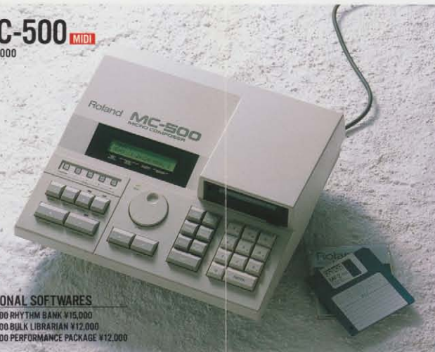
MC-500 MIDI ¥155,000

OPTIONAL SOFTWARES MRD-500 RHYTHM BANK ¥15,000 MRB-500 BULK LIBRARIAN ¥12,000 MRP-500 PERFORMANCE PACKAGE ¥12,000