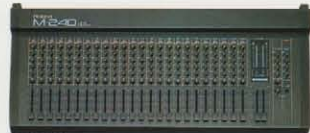
M-240 24 CHANNEL LINE MIXER ¥149,000

ミュージック・シーンの中心で設計された新ミキサー。●楽器のステレオ・アウトやMIDI化によるマルチ・イン/アウト、マルチ・アウトに対応してM-240は24インプット、M-160は16インプット。余裕の入力数を確保。●デジタル楽器群のクリティ・アンプに対応してプロ用高域補正クラスの高音質。●入出力は実務用+4dBに対応。●出力端子はアンバランス/バランス型の双方を装備。●各チャンネルごとに4系統のエフェクト・センド装備。リターンは3系統がステレオ、1系統がパンポット付。複数のエフェクトを自由に活用可能。●スタッキングも容易。●M-240は解放型キーボード・スタイル、M-160はラック・マウント4Uサイズ。