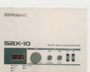
SBX-10 MIDII SYNC BOX ¥48,000

SMPTETIME・コードを採用したプロ・ラプ・テンポ・コントローラー。●放送機材と電子楽器との同期演奏が可能。●多重録音時において、テープ途中からの同期演奏やリズム・マシンなどによるオート・リズムの待機演奏が完璧に行なえます。