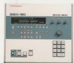
SBX-80 MIDII SYNC BOX ¥198,000

SMPTETIME・コードを採用したプロ・ラプ・テンポ・コントローラー。●放送機材と電子楽器との同期演奏が可能。●多重録音時において、テープ途中からの同期演奏やリズム・マシンなどによるオート・リズムの待機演奏が完璧に行なえます。