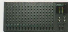
BX-16 16 CHANNEL STEREO MIXER ¥79,800