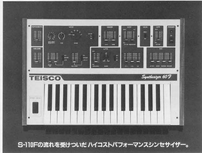
S-110Fの流れを受けついでハイコストパフォーマンスシンセサイザー。