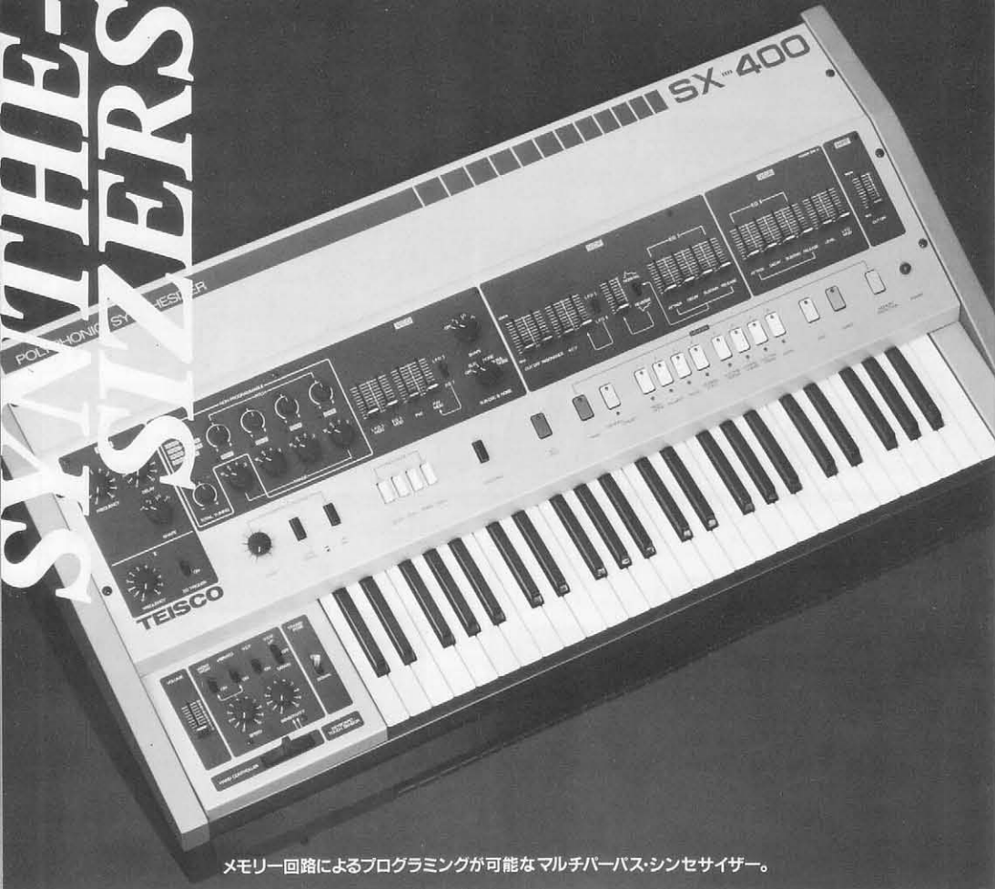
メモリー回路によるプログラミングが可能なマルチハーバースィンセサイザー。