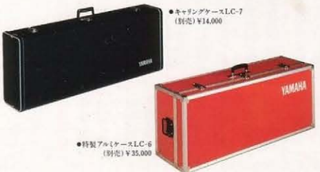
●特製アルミケースLC-6 (別売) ¥35,000

バイオリン&ビオラ系とセロ系の2系列5種類の弦楽器の音色。音域4オクターブのストリングスキーボード。単音演奏の、ソロプレイからコード演奏の、オーケストラバックまで、自由自在に室内楽的表現ができるポリフォニックタイプで、ストリングス(腕楽器)独特の音色や奏法を、あますことなく捕えるために数々のエフェクトコントロールを装備しています。たとえば、音の立ち上がり時間を自由にコントロールする働きのアタックノブを使えばレガートもスタッカートも思いのままに表現できます。また、鍵盤の高域部と低域部を分け、べつべつの音色にセットできるキーボードスプリットノブを使えば、バイオリンとセロの室内二重奏もでき、ピッチャートなど豊かなストリングスならではの感情表現を可能にしています。ディレイノブは弦楽器奏法に、独特なディレイピッチャートをかけて厚重な音の広がりを出します。デチューンはバイオリン、ビオラ系とセロ系の2系列のピッチをずらすことが可能。複数の弦楽器による音の厚み(コーラス効果)も出せます。また、フェイズシフトエフェクトによりコーラス効果を増大させる、オーケストラ効果スイッチも装備しています。セカンドキーボードとしての使い方も充分に考慮。大型キーボードの上にセットしても、優れた演奏性を保つように鍵盤は傾斜をもたせて、設計されています。ストリングススキューボードの限界を破った、プロフェッショナルのための、新しいキーボードです。