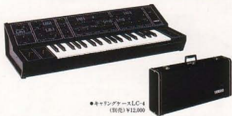
●キャリングケースLC-4 (別売) ¥12,000

CSシリーズのベストセラー。数学的に整理されたパネルレイアウト、フローイングの可能性を限定することなく、複雑なパッチング作業をワンタッチでこなすノブスイッチ群。エフェクティブな表現を可能にするポルタメントとピッチベンド。「音楽」に直結する演奏性を最重要視した、ライブパフォーマンスに強いシンセサイザー。安定したピッチ。ヤマハ独自のIL、AL、A、D、R方式のVCF-EGなど大型機なみのコンソリドギアです。