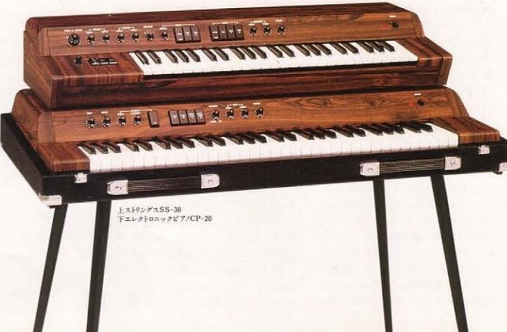
上: ストリングスSS-30 下: エレクトロニックピアノVCP-20

◎標準装備品: 電源コード ※ポリウムベダルFC-3(別売) ¥4,000 / ナス ティンベダルFC-4(別売) ¥3,000