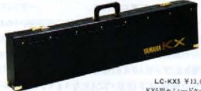
LC-KX5 ¥13,000 KX5用セリードケース

境地をお楽しみください。送信チャンネル1/2が選べる、MIDIチャンネルセクターの搭載により、DX/RXを瞬時に切り換えての演奏もOK。キートランスポーズ機能により音域は5オクターブ。KX5を持って、キーボードプレイヤーは「マスター・オブ・セレモニー」です。シルバーマタリックとブラックレーザンサテンの、2カラーを用意しました。