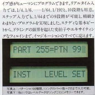
写真上：1/4ターンの100種類、1ソングの1パート=255まで入力可能。写真下：RX11ではレベルゲータがソングごとにメモリーできます。

衝撃のデビューをかけた、ブラックフェイスのPCM音源デジタルリズムプログラマーRX11。プロフェッショナルなスペックで全身を固め、ミュージックシーンを大きく盛り変えました。先進の大容量256kビットROMを、何と6チップも投入。究極の高品位サウンドを29音色メモリーして、リズムアレンジの可能性を一挙に広げたのです。プログラム機能もフル装備。ステップリアルタイム、2つの入力方法が可能なのはもちろん、入力する音の長さを設定するクォンタイズ=1/192、ステップライトの緻密さも別格、4/4から99/32まで自由に設定できる拍子記号、ソングごとにプログラムできる、音色独立レベル/アクセントレベル/パン機能など、高度さとロジカルリティには、比類ないものがあります。自照式LCDディスプレイ、LEDディスプレイがプログラムプロセスをメッセージ、デジタルネットワークプレイを実現するMIDI端子やレコーディング対応12ch独立アウトなど、リアパネルも万全の態勢。RAMカードリッジにメモリー拡張できるもRX11のメリット。これぞリズムマシンです。ドラマーのインスピレーションを伝える、PCM音源29音色。RX11には、PCM収録による音色データROMを6チップ搭載しました。独自の半導体テクノロジーによる先進の256kビットが、打楽器音の衝撃的なアタック・ビークから、シンバルの減衰のニュアンス、ベースドラムの空気感といったものを、フルサイズで伝えます。そして、29種類のワイドパリエーションも驚異的。ハイハットのクローズドとオープンが各2種類、ベースドラム3種類、タム4種類。スネアドラムに代わっては、デプスやスナッピーのバリエーションで、8種類も搭載。曲のフィージングにベストフィットしたアレンジ、音色の選択が意のままにできる、プロ・スペックです。パターン、ソング、チェイン。プログラム能力も無限。入力はもちろんリアルタイム/ステップ、両方式が可能。拍子の設定も4/4から99/32まで思いのままです。また、入力する音長の最小単位を拍子記号の拍数と別個に設定できるクォンタイズ機能は、最大1/192=192分音符。ドラ