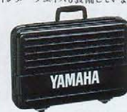
LC-RX ¥13,500 RX11,15用キャリングケース

のテンポ変更ができるテンポチェンジ機能も、しっかり装備。複雑なソングコンポジションにも、ぜひ挑戦してください。デジタルネットワークのためのMIDI端子も装備。アウトはステレオ。もちろん、デジタル楽器国際共通規格のMIDI端子も装備しました。デジタルシンセサイザーDX、ミュージックコンピュータCX、デジタルシンセサイザーレコーダーQXなど、MIDIインストゥルメントたちと接続すればシンクロプレイ、シーケンズプレイが楽しめます。また、メモリーデータのセーブや、クロック信号によるシンクロプレイを可能にする、カセットインターフェイスも装備しています。